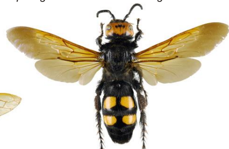
Vespa Mamute, Megascolia maculata