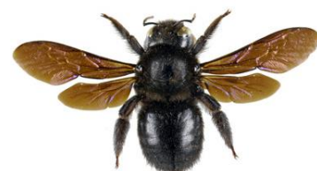
Abelha Carpinteira, Xylocopa violacea