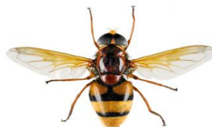
Mosca das flores, Volucella zonaria